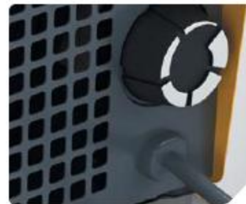
Встроенный терморегулятор от 0...+40 °С