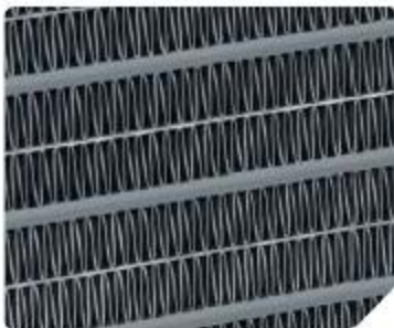
Металлокерамический нагревательный элемент класса А

Профессиональные тепловентиляторы в компактном ударопрочном корпусе с металлокерамическим нагревательным элементом (гарантия 5 лет)