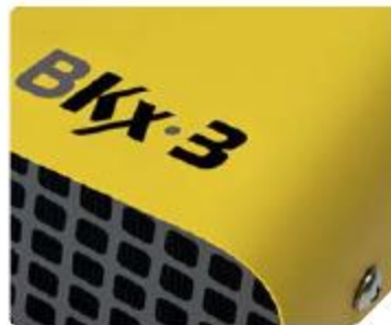
Прочный корпус из стального листа