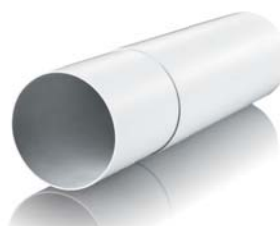
Канал круглый телескопический Ø 125 мм, длина 500-1000 мм