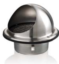
Колпак наружный нержавеющий MBM 122 6Bc H