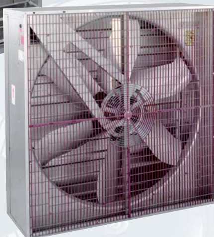
Защитная решетка на стороне входа воздуха

Осевые вентиляторы с ременным приводом серии НІВ-NP/НІТ-NP предназначены для непосредственного перемещения больших объемов воздуха.