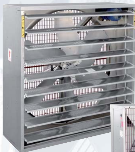
Жалюзи на стороне выхода воздуха